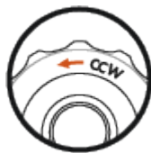
Direzione regolazione CCW