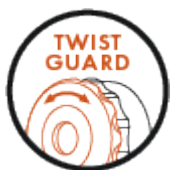
Protezione antirotazione TWIST GUARD