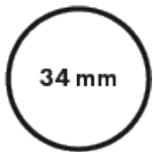
Diametro tubo principale 34mm