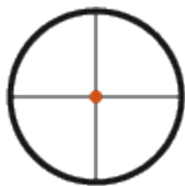
1. Piano focale