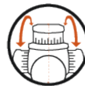
Regolazione lato sinistro/destro