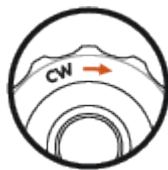
Direzione regolazione CW