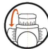
Regolazione laterale sinistra