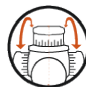
Réglage latéral gauche ou droit