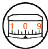
Tourelle d'élévation EasyRead