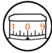
Tourelle d'élévation EasyRead