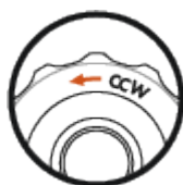
Direction de réglage CCW