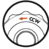
Direction de réglage CCW