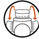
Réglage latéral gauche ou droit