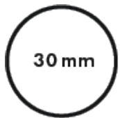
Diamètre du tube central 30mm