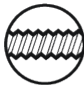
SR Rail (en option)