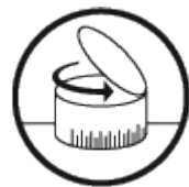
Tourelle Balistique (en option)