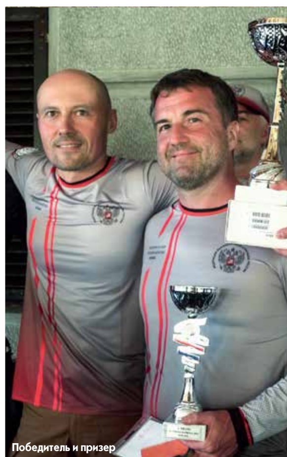
Победитель и призер

Спортсмены Федерации высокоточной стрельбы России уверенно побеждают на международных турнирах. В Сербии российские спортсмены в очередной раз подтвердили свой высокий уровень подготовки. Успехи нашей сборной – это еще один весомый вклад в одну из основных задач федерации: признание высокоточной стрельбы видом спорта в нашей стране.