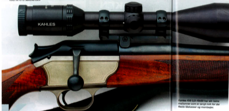
Kahles KXI 3,5-10x50 har ein tona mellonær som er langt nok for dei fleste lukseør og monterer.

KAHLES ER EIT gammalt soppnærn i optikk for jegerar, og Kahles KXI 3,5-10x50 L har heile retikkel og topp optikk. Dette er typisk for sikte ment for europeiske jegerar. Detonar er 3 x zoomområde, elastona mellonær og treffpunktjustering med klikk på 0,7 cm mtr amerikansk. Korleis passar så Kahles KXI 3,5-10x50 til norsk jakt, og kva med KXI 3,5-10x50 samrøleira med andre liknande sikte?