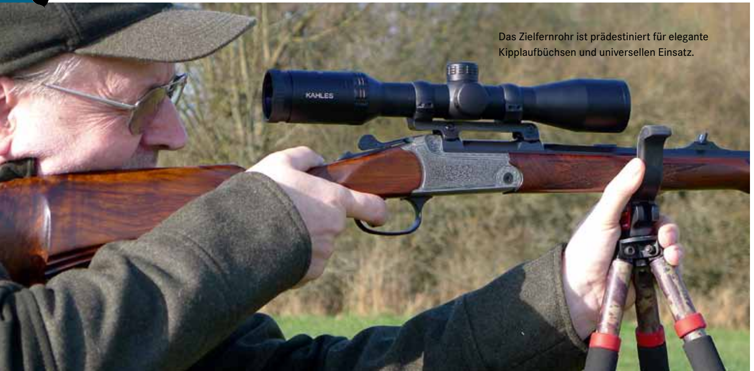
Das Zielfernrohr ist prädestiniert für elegante Kipplaufbüchsen und universellen Einsatz.

mit Werkzeug nullen. In einer Abdeckkappe befindet sich eine Ersatzbatterie für das Leuchtabsehen. Praktisch geht unbeleuchtet der Punkt in Fadenkreuzmitte des Absehens 4-Dot unter. Die feinen Linien decken auf 100 m bei 8-fach nur 4 mm ab, die Balken 35 mm und der Leuchtpunkt 18 mm. Ein Absehen in der 2. Bildebene, das sehr wenig vom Geschehen verdeckt.