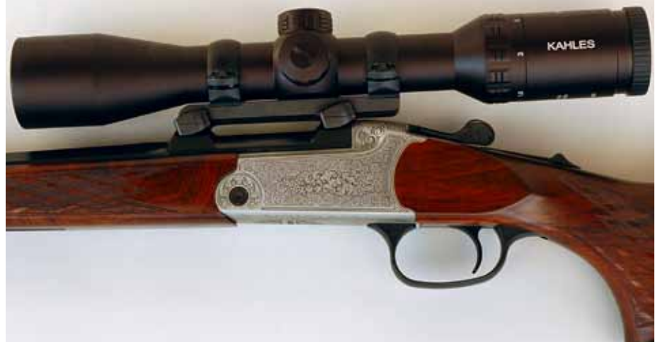
Das Okular fällt zugunsten eines sehr großen, sicheren sowie komfortablen Sehfeldes stark aus.