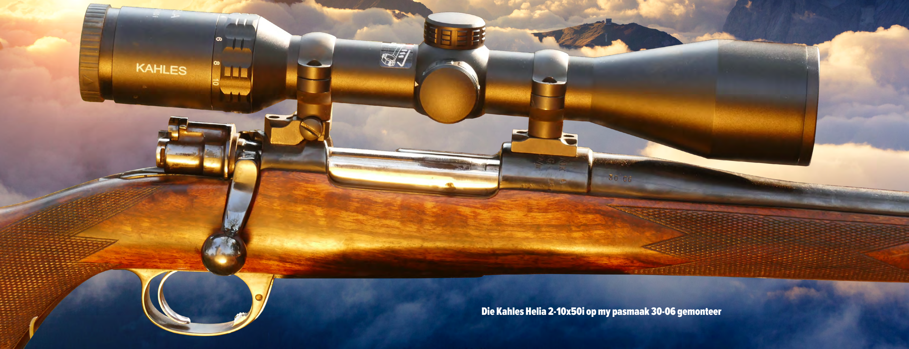
Die Kahles Helia 2-10x50i op my pasmaak 30-06 gemonteer

deurdat die fabriek geforseer was om optiese toerusting vir die Weermag te vervaardig. Gedurende 'n bom aanval deur die Geallieerde Magte in 1945, is die Kahles fabriek totaal verwoes en die eienaar Karl Kahles het met sy lewe geboet.