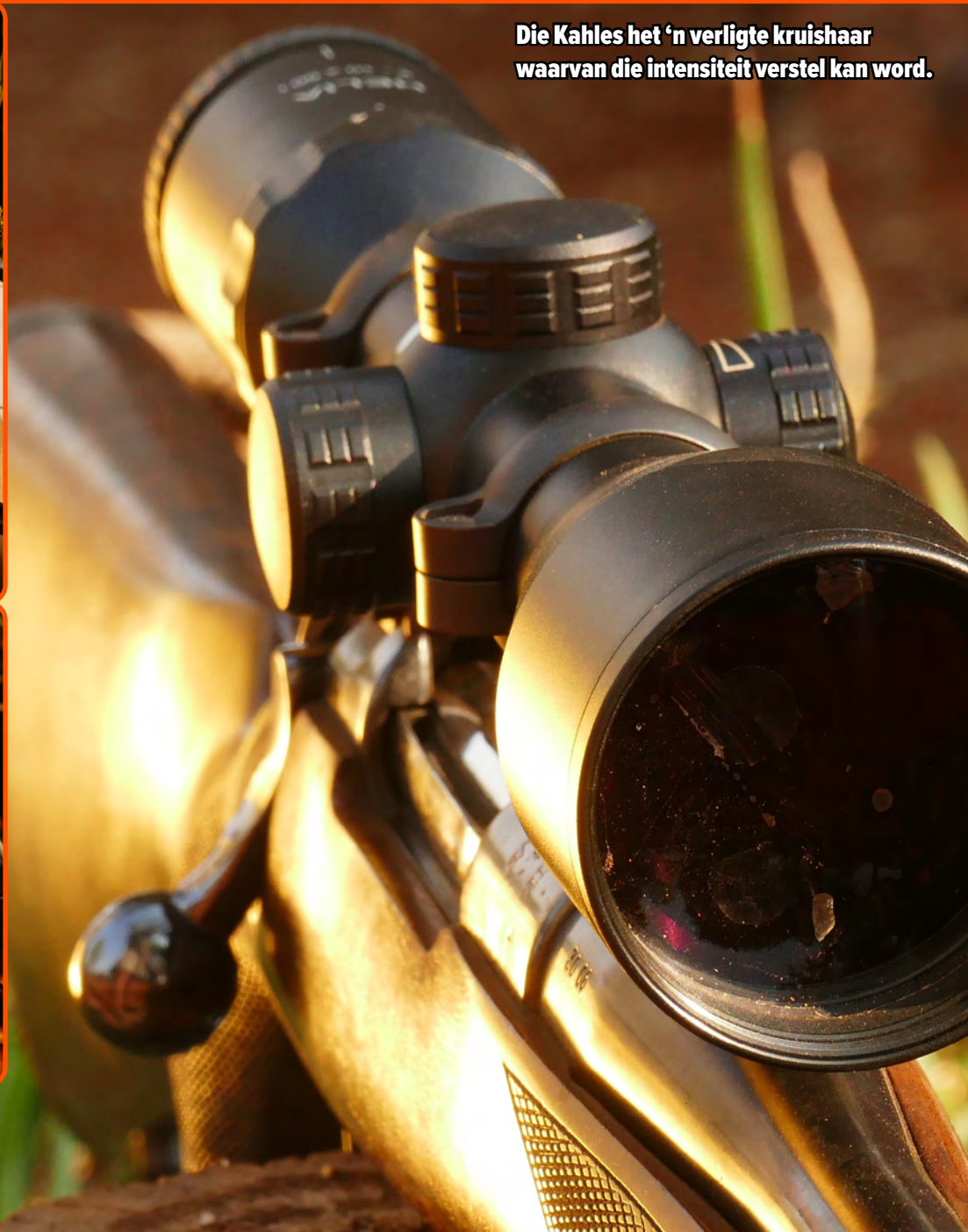
Die Kahles het 'n verligte kruishaar waarvan die intensiteit verstel kan word.