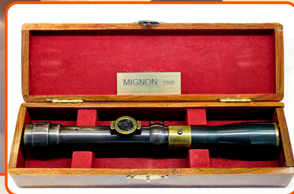
In die Kahles fabriek se vertoonlokaal is daar verskeie voorbeelde van hul eerste produkte.