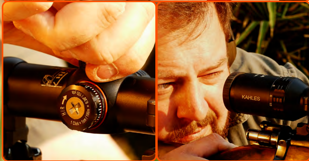
Dit stel een sentimeter op 100 meter en die kliks is duidelik waarneembaar en hoorbaar.