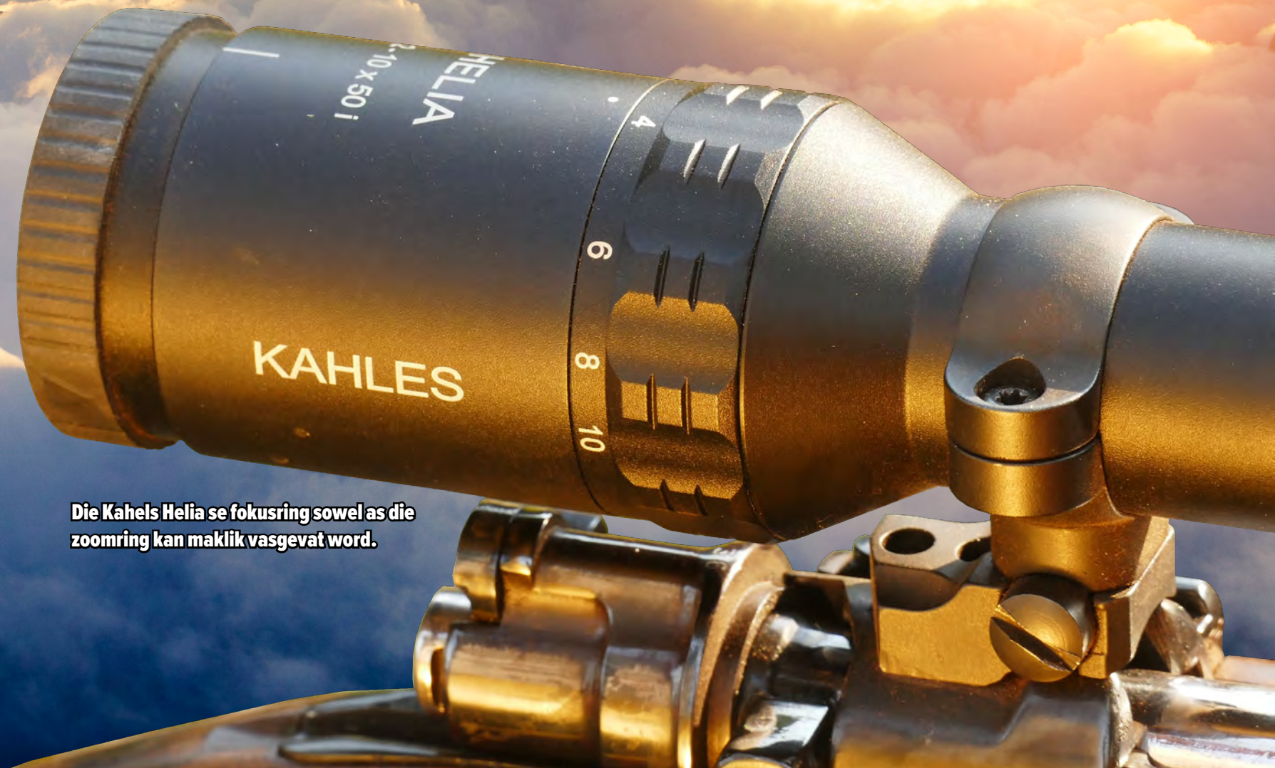
Die Kahles Helia se fokusring sowel as die zoomring kan maklik vasgevat word.