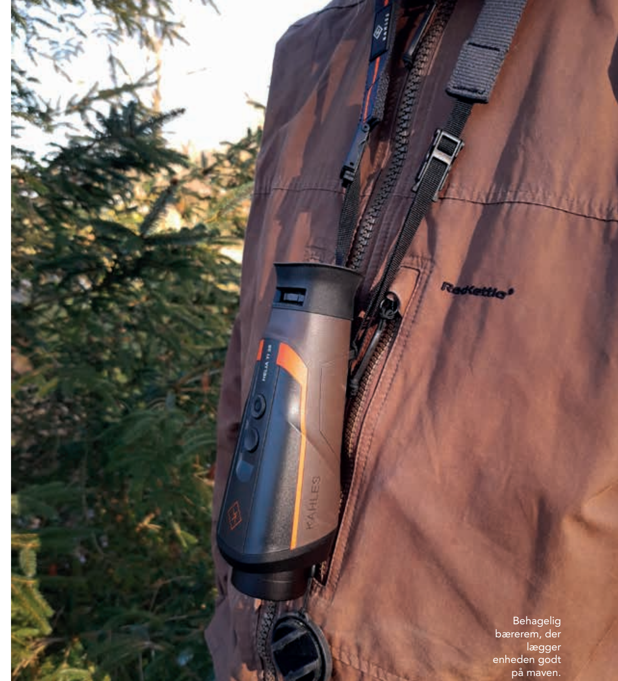
Behagelig bærerem, der lægger enheden godt på maven.

Opladning foregår via den eneste port, der er i enheden, som er et helt standard USB-C stik. Hvis uheldet skulle være ude, så er det nemt at koble en powerbank til for lidt ekstra strøm.