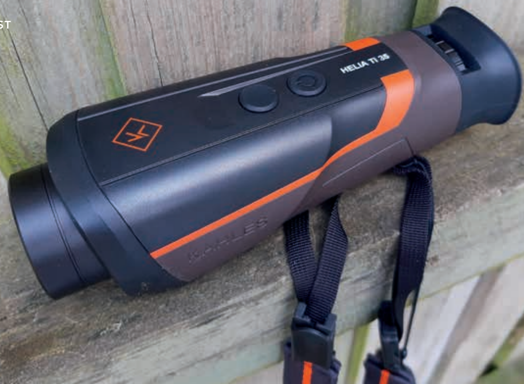
Enkel og stilet!

Der er præcis de funktioner, der skal til. Hverken mere eller mindre. De funktioner der er, sidder imidlertid lige i skabet. Den optiske kvalitet er præcis så god, som jeg har oplevet på tilsvarende enheder.