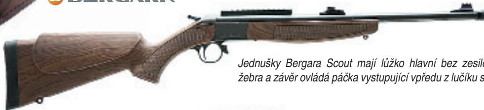
Jednušky Bergara Scout mají lůžko hlavní bez zesilovacího žebra a závěr ovládá páčka vystupující vpředu z lučíku spouště.