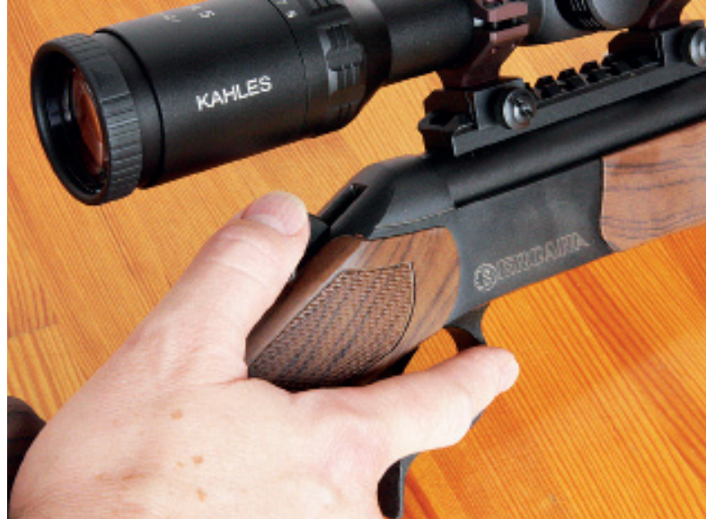
Kohout s bočním palečnickem na ostruzi se ovládá pohodlně a jistě.