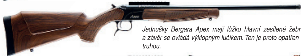
Jednušky Bergara Apex mají lůžko hlavní zesílené žebrem a závěr se ovládá výklopným lučíkem. Ten je proto opatřen ostruhou.