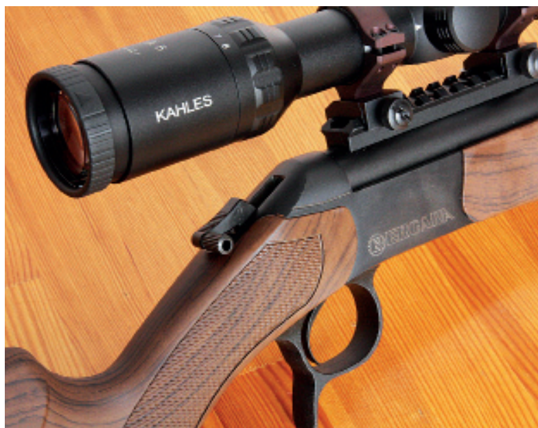
Napnutý kohout Bergary BA 13.