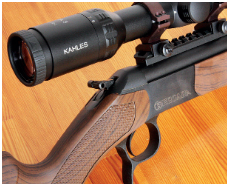
Kohout Bergary BA 13 má odskok a bije na vložený inerční zápalník. Zde kohout v přední poloze. Palečník je možné jednoduše přešroubovat na druhou stranu, takže vyhoví i levákovi.